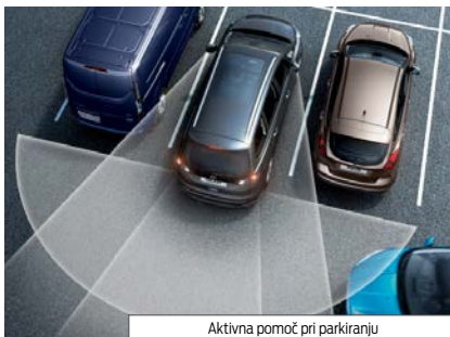
Aktivna pomoč pri parkiranju

Prilagodljiv sistem statičnih luči za dinamično osvetlitev zavoja pri počasnem zavijanju osvetli ovinek in s tem pomaga, da vidite dlje. Osvetlitev sledi premiku volanskega obroča in zagotavlja večjo varnost ter boljšo vidljivost pri vožnji ponoči.