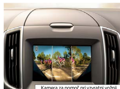
Kamera za pomoč pri vzratni vožnji