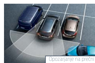
Opozarjanje na prečni promet