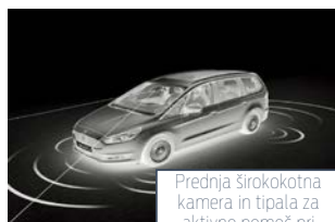
Prednja širokokotna kamera in tipala za aktivno pomoč pri parkiranju