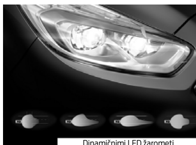
Dinamičnimi LED žarometi