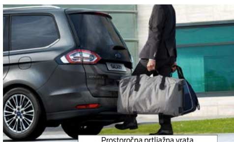
Prostorčna prtlačna vrata