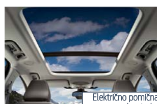
Električno pomična panoramska streha