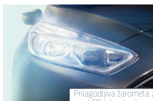
Prilagodljiva žarometna z LED tehnologijo