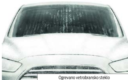
Ogrevano vetrobransko steklo