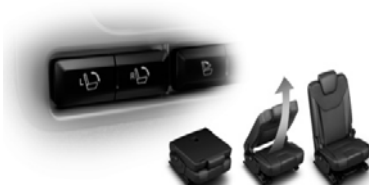
Električno podiranje sedežev v tretji vrsti