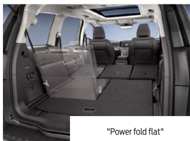
"Power fold flat"