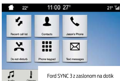
Ford SYNC 3 z zaslonom na dotik