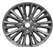
17" 10x2-kraka platišča iz lahke zlitine (Serijska oprema Titanium)