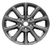
17" 10-kraka platišča iz lahke zlitine (Serijska oprema Trend)