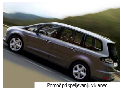
Pomoč pri speljevanju v klanec