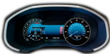
Titanium - digitalni merilniki